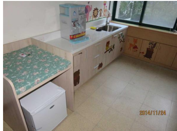
清洗及更換尿布檯