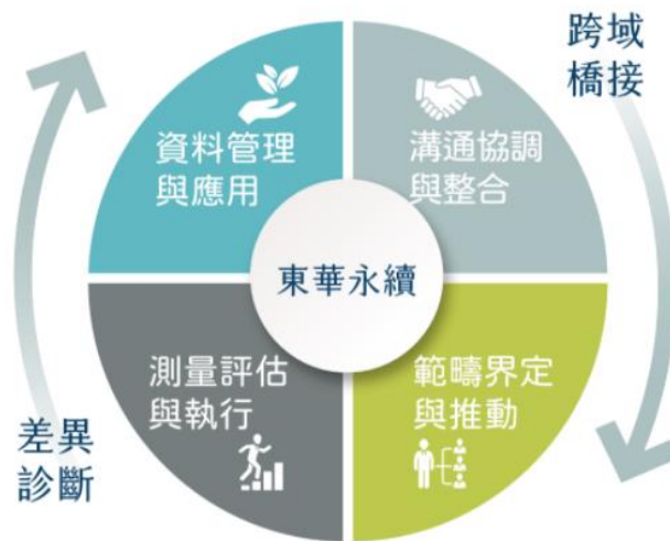
永續發展辦公室任務