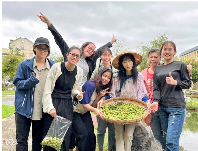
▲梅花三弄-採梅&釀梅