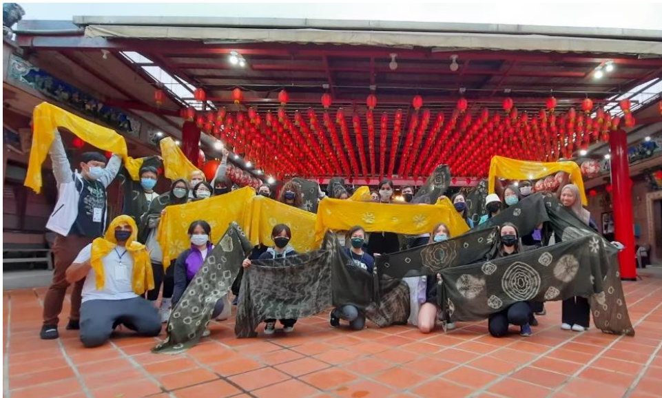
▲ 薄染青衫—壬寅金秋華語文中心植物染采風體驗