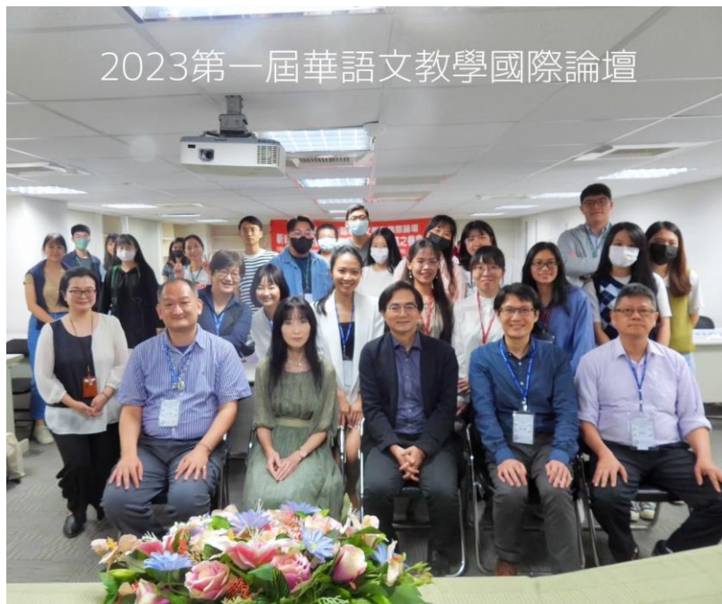
▲第一屆東華大學華語文教學國際論壇