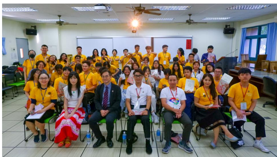
▲2023 悠遊東華-華語與科學夏令營