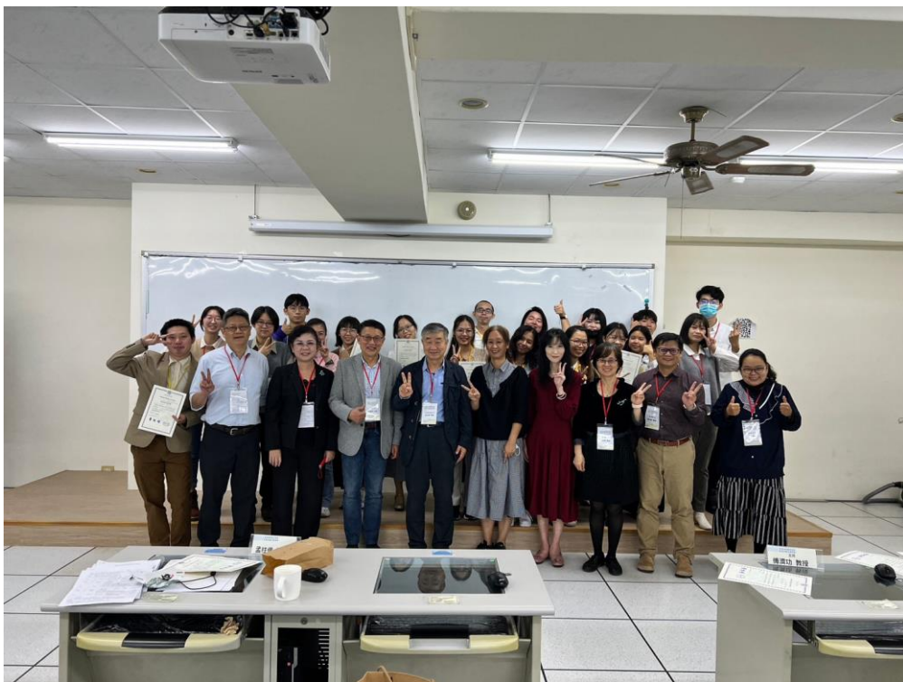
▲台東華語教學研討會&參訪