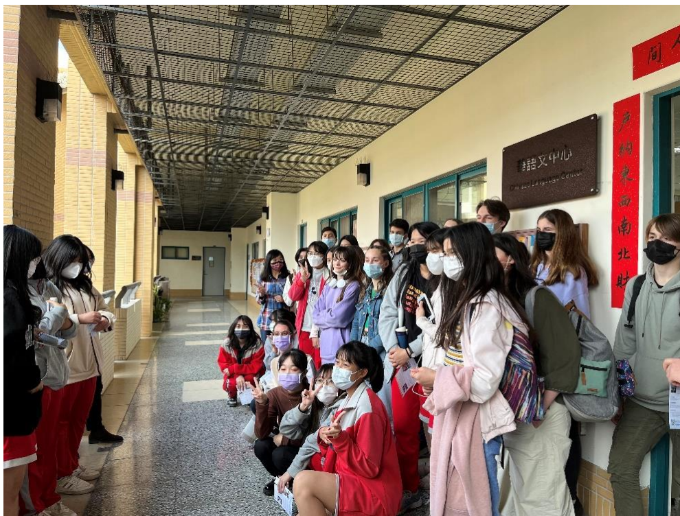
▲法國布列塔尼中學參訪接待