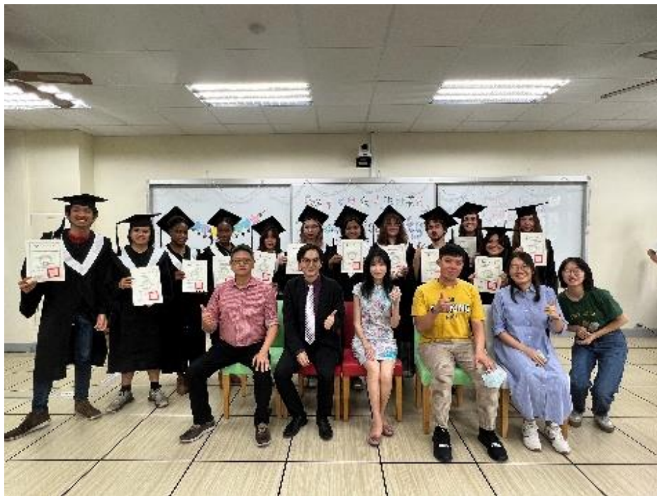
▲2022 秋季班結業式暨期末餐會