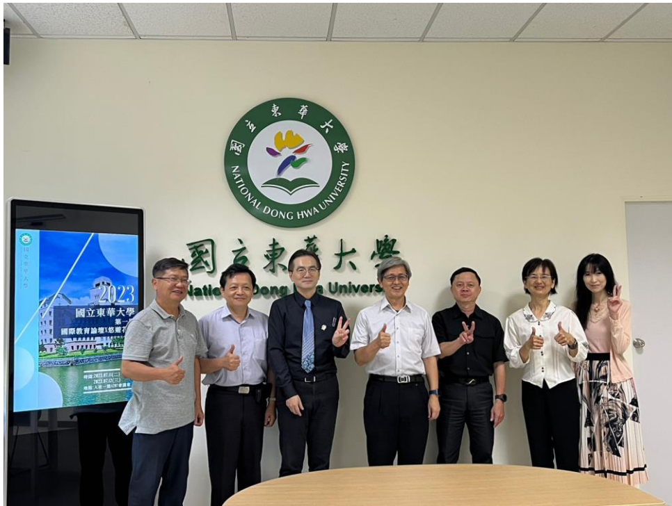
▲2023 國立東華大學第一屆國際教育論壇