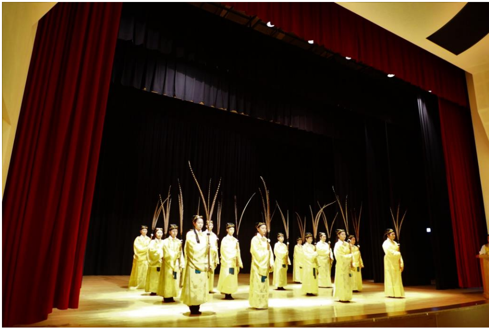
▲四佾舞期末成果展與專題演講