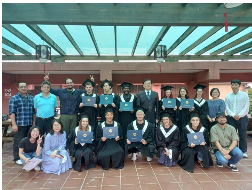
▲2023 春季班結業式暨期末才藝成果展