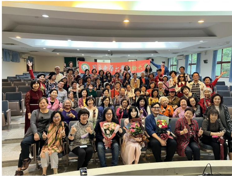
▲民歌演唱會-還念的旋律常在我心