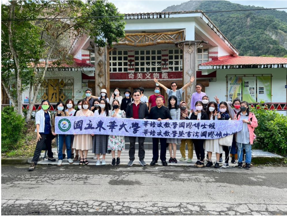
▲ TCSL & CLC 博物館之旅