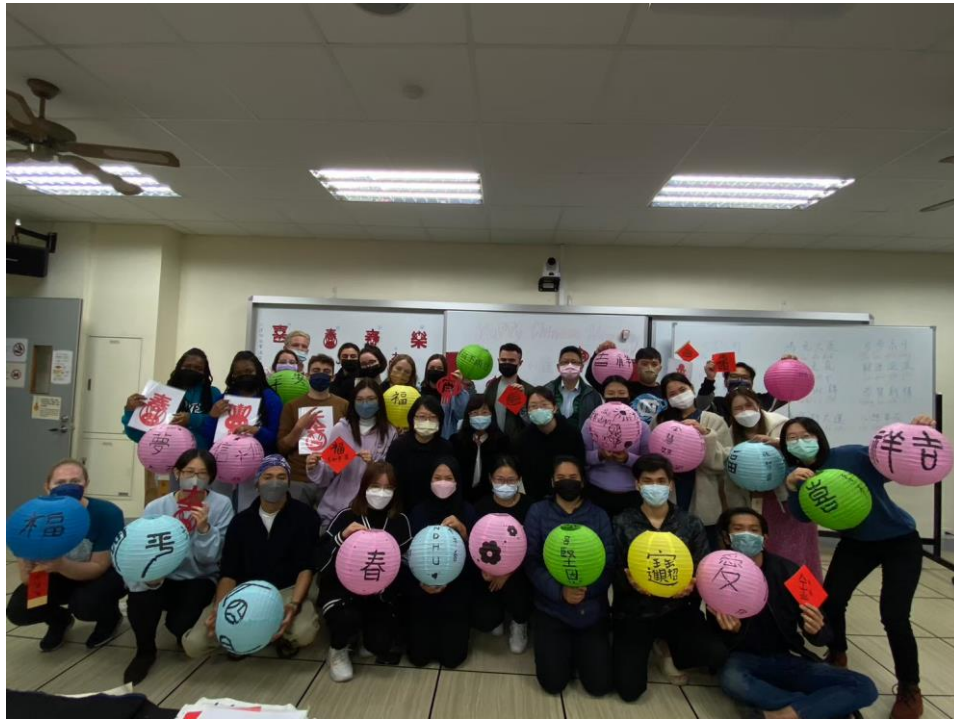
▲2022 冬季文化活動-剪出新春好運到