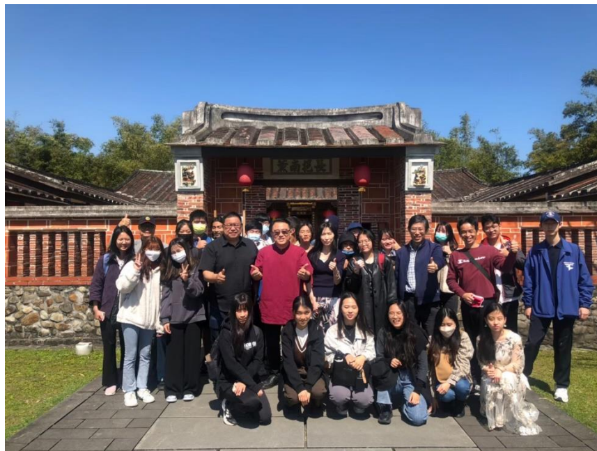
▲ 探索宜蘭傳統藝術中心