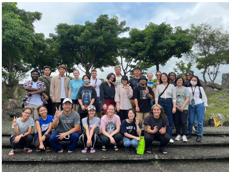
▲2023 春季活動-獨木舟體驗