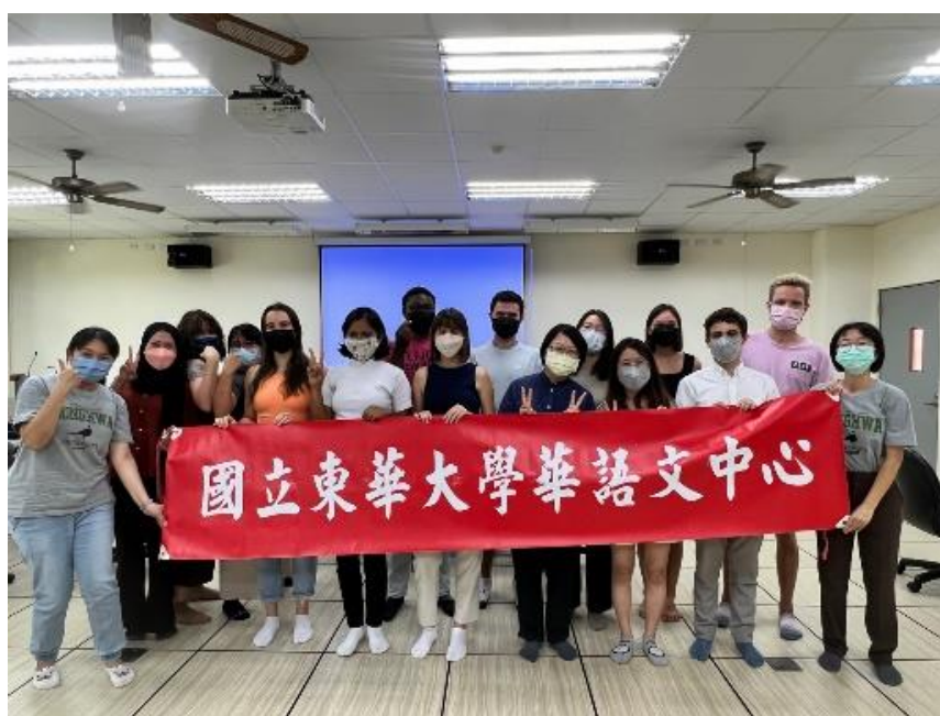
▲ 2022 秋季班師生迎新餐敘