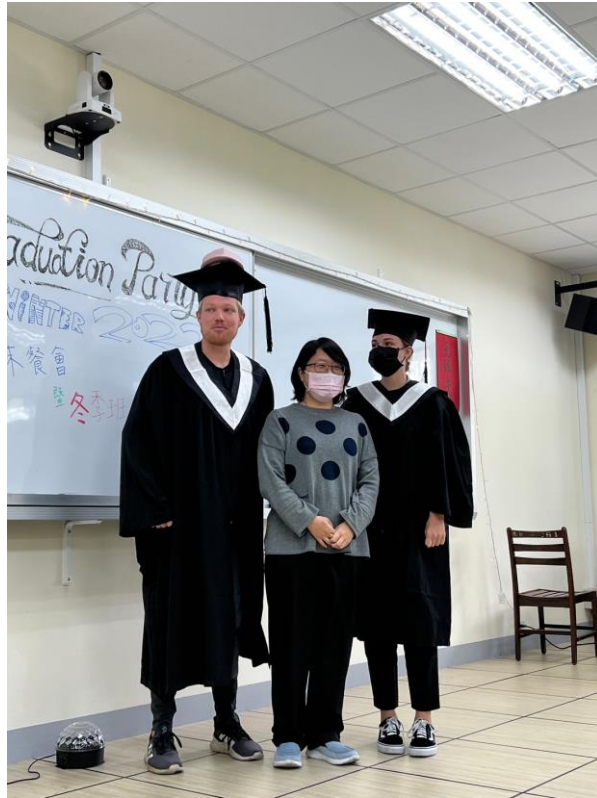
▲2022 冬季班結業式暨期末餐會