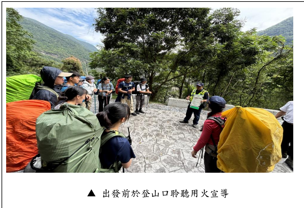
▲ 出發前於登山口聆聽用火宣導