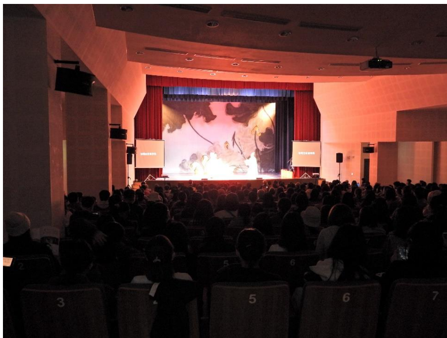
▲ 台灣崑劇團風情月意<<玉簪記>>演出