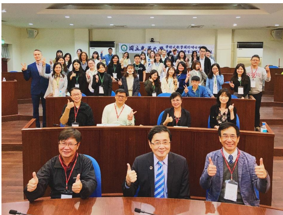
▲國立東華大學華語文教學國際研討會-1