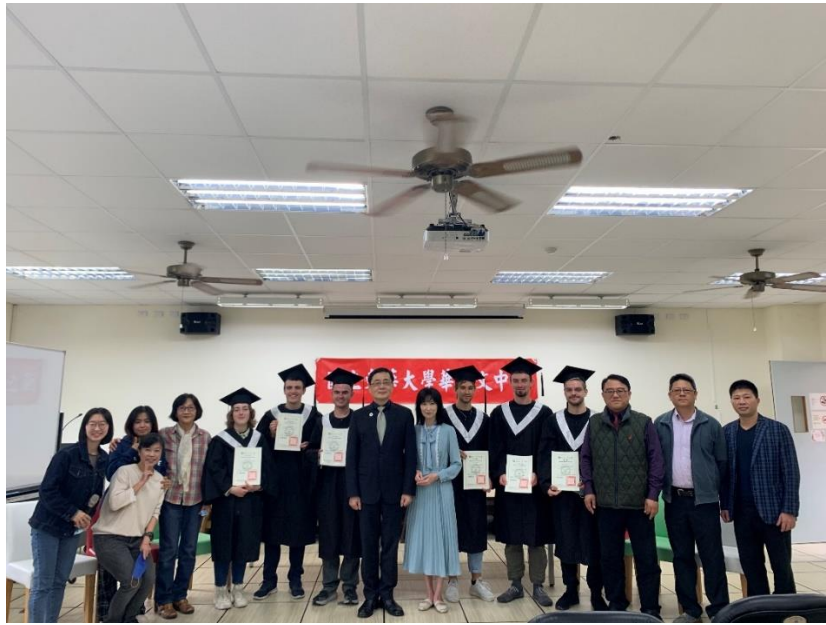
▲季節班結業式暨歲末聯歡會