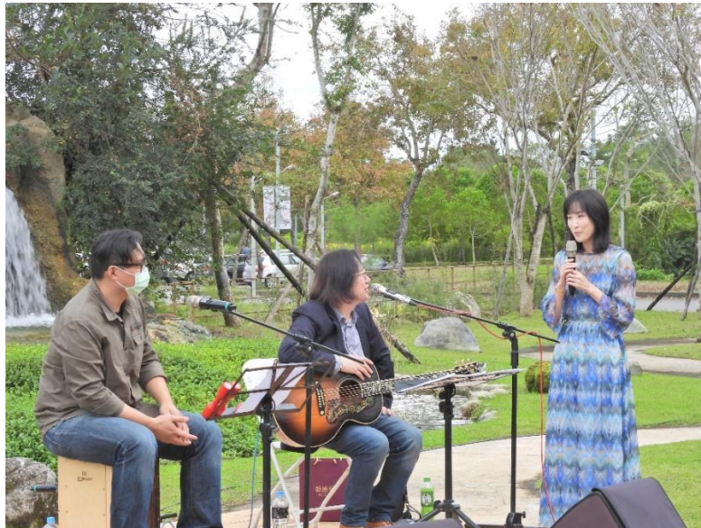
▲詩經花園校園民歌演唱會