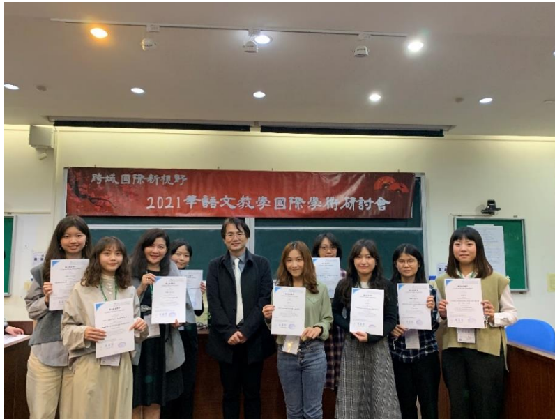
▲國立東華大學華語文教學國際研討會-2