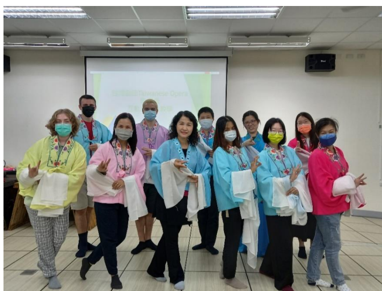
▲ 台灣戲曲-歌仔戲互動式體驗課