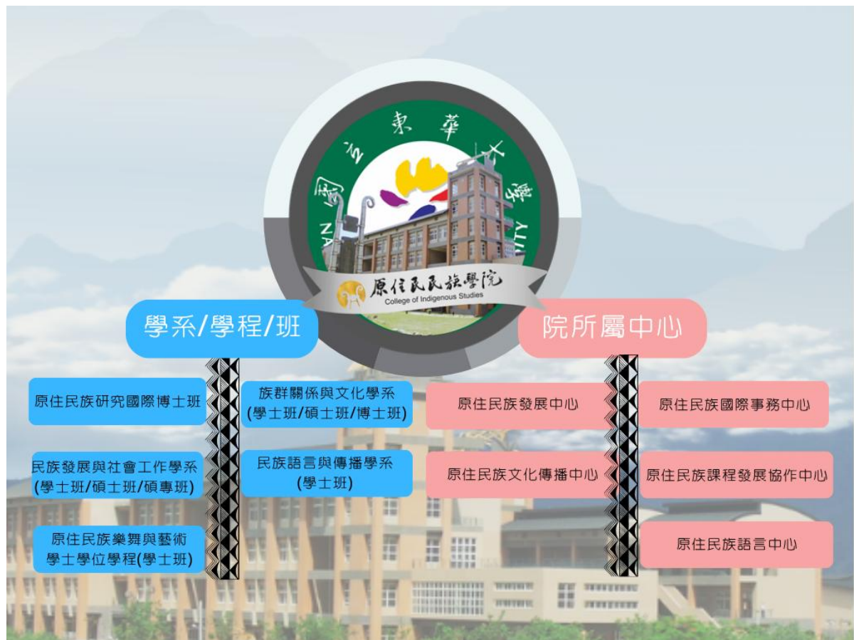
原住民族學院單位架構圖

本學院目前設有原住民族研究國際博士班。族群關係與文化學系(學、碩、碩專、博士班)、民族語言與傳播學系(學士班)、民族發展與社會工作學系(學、碩、碩專)、原住民族樂舞與藝術學士學位學程(學士班)、原住民族發展中心、原住民族文化傳播中心、原住民族國際事務中心、原住民族課程發展協作中心、原住民族語言中心，職司原住民族與族群議題相關領域之教學、研究與推廣。