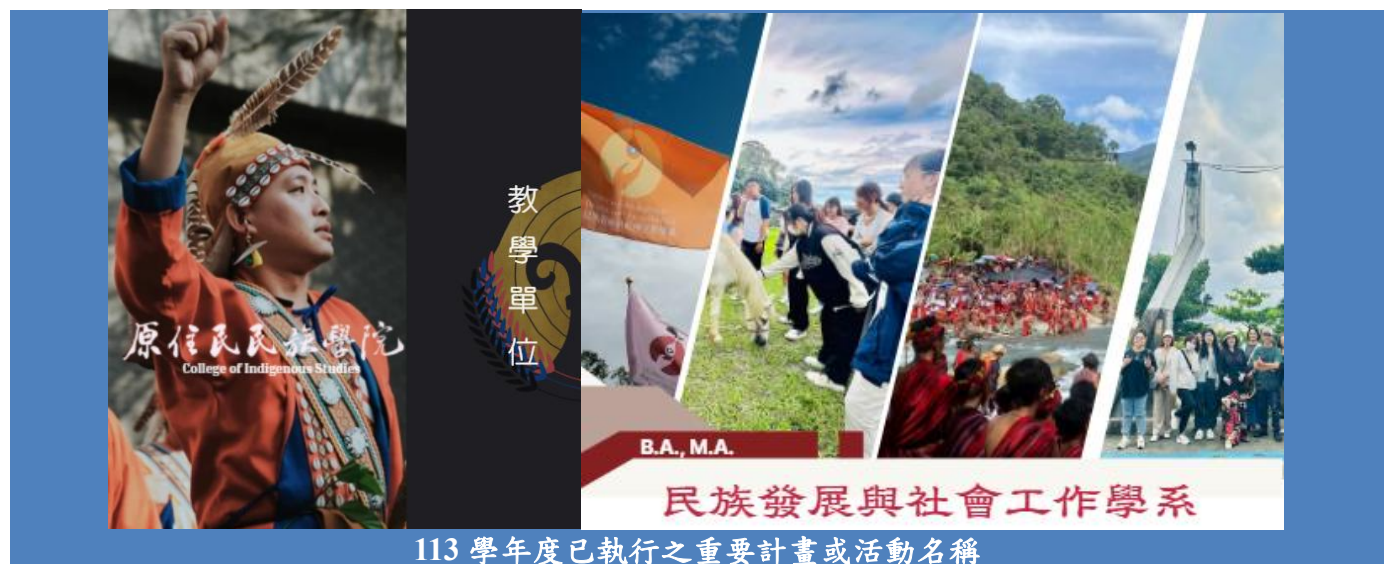
113 學年度已執行之重要計畫或活動名稱